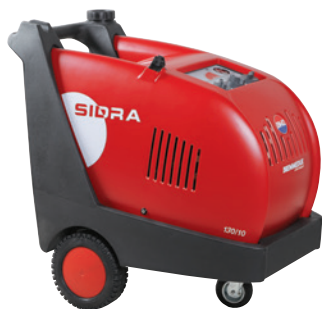
Quadro Elettrico 24 V 24 V Control Panel