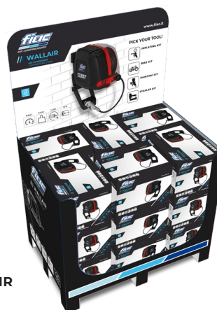
/// PALPACK WALLAIR TRD PALPACK WALLAIR GDO