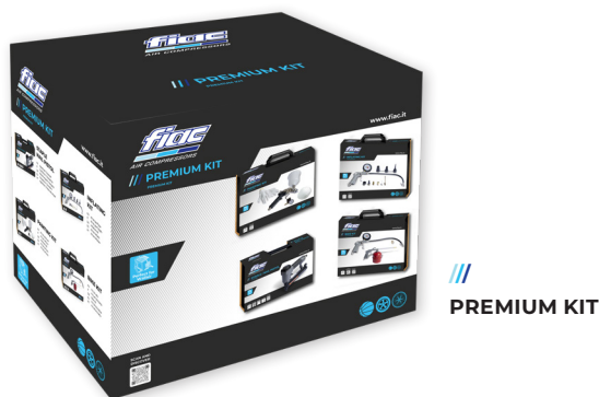
/// PREMIUM KIT

Ti offriamo la possibilità di svolgere più operazioni legate a una data attività, così di avere a disposizione un'intera gamma di accessori adatti ad ogni uso. Trova il kit per le tue esigenze. Wallair provides a solution to multiple applications, and we want to offer you simple and effective activity-based kits. Find the best for your needs.