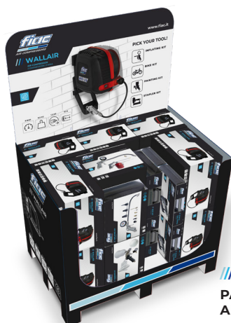
/// PALPACK WALLAIR AND KITS

Remove the external film, open the case and fold it to display the crowner. Ready for your shop.