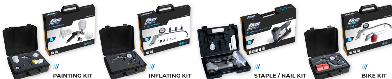
/// PAINTING KIT